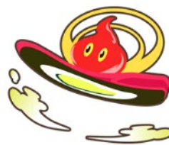
ME-03 IIをイメージした エナジーくんII

aruku&アプリ内の地図上、全国 20 万か所に「ME-03 II」をイメージした「エナジーくんII」、「WAVE XE-1」をイメージした「ミズノくんXE」が登場。キャラクターに話しかけ、依頼された歩数（例：3時間以内に1000歩あるく）を制限時間内に達成すると応募カードがもらえます。応募カードをあつめると、「ME-03 II」もしくは「WAVE XE-1」が抽選で合計10名（2種類×各5名）にあたります。