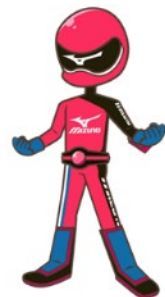
WAVE XE-1をイメージした ミズノくんXE