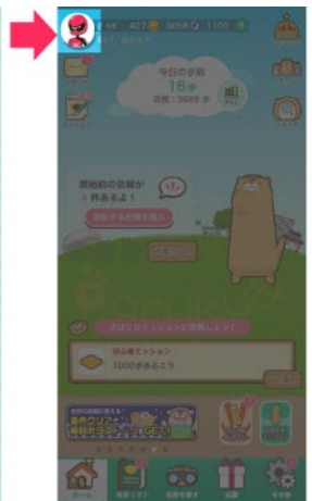
おたすけポイントを50にすると自身のアイコンに設定可能

(2) 自分にぴったりのシューズを見つけよう！おすすめシューズ診断 特設ページでご自身のウォーキングに関する4つの簡単な質問に答えると、「ME-03 II」もしくは「WAVE XE-1」いずれか、相性の良いシューズをおすすめします。おすすめされたシューズはミズノ公式オンラインショップで購入できるほか、診断結果は SNS (Twitter、Facebook) でシェアができます。