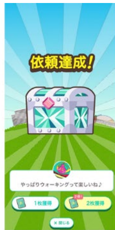
3.制限時間内に規定歩数を歩くと依頼達成