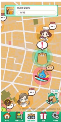
1.マップ上で対象の住民に近づき話しかける

なお、依頼を達成すると、依頼の難易度に応じて3～4の「おたすけポイント」が貯まります。おたすけポイントが合計50になったキャラクターは、自分のアイコンとして設定することができます。