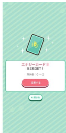
4.応募用のカードを獲得